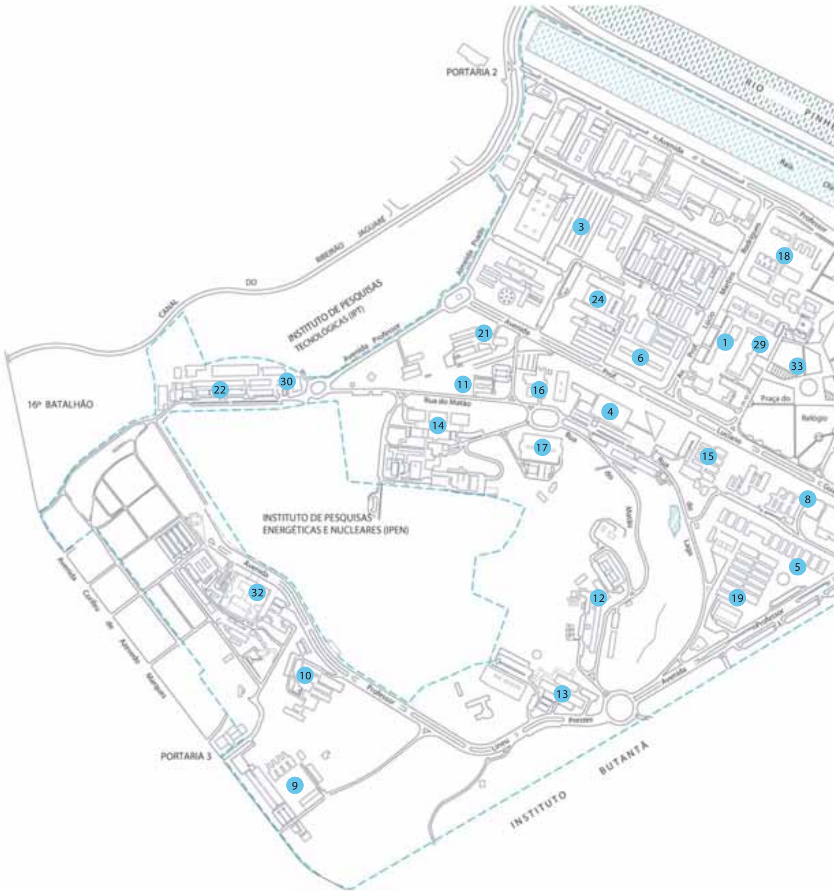
Mapa do campus da capital – Coordenadoria do Espaço Físico da USP